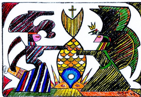
El pez surgirá triunfante en el 2002 (1949)